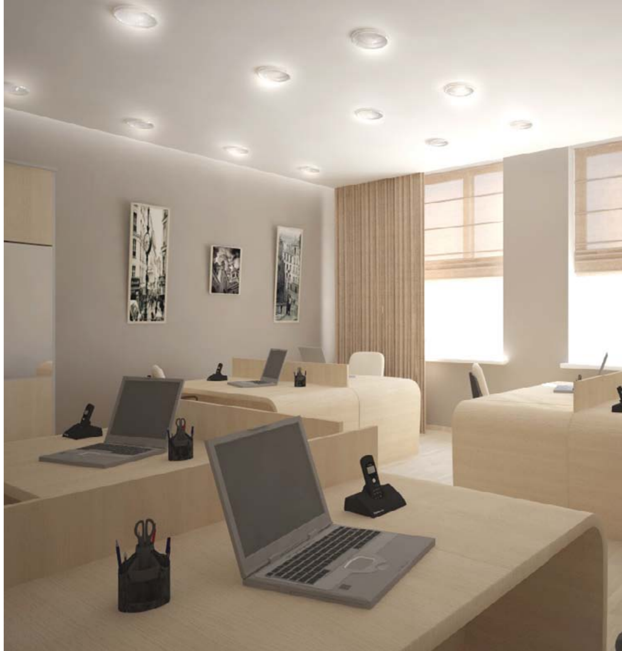
«Интерьер помещений в проектируемом объекте Апарта отель»