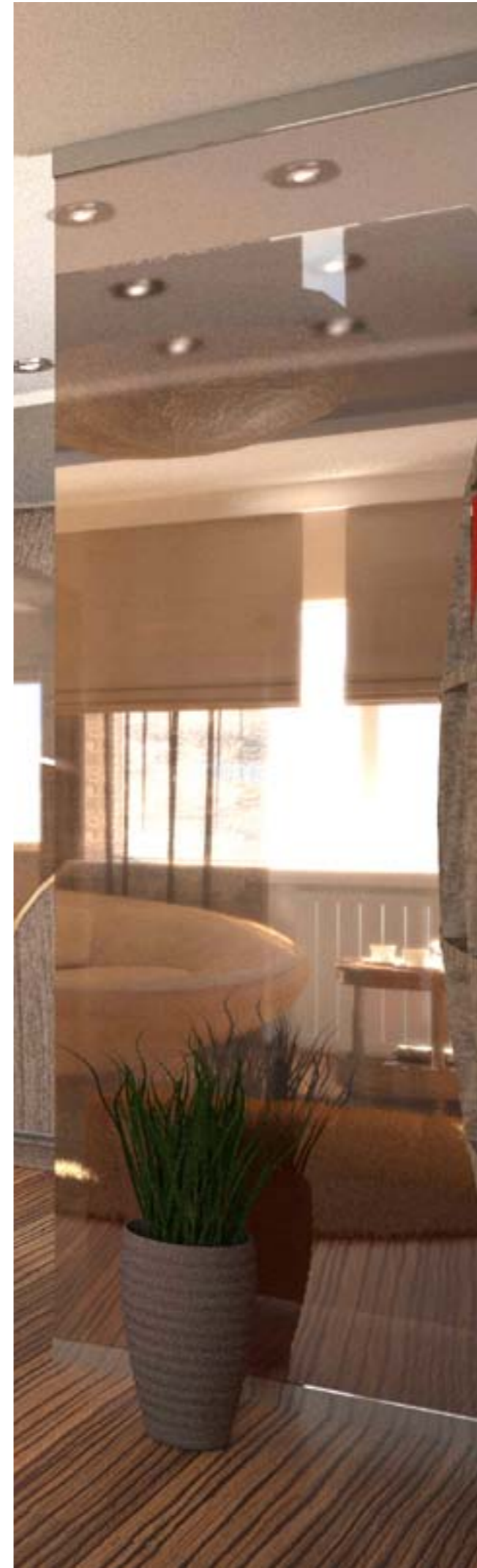
Interior of high-rise apartment house The educational project.