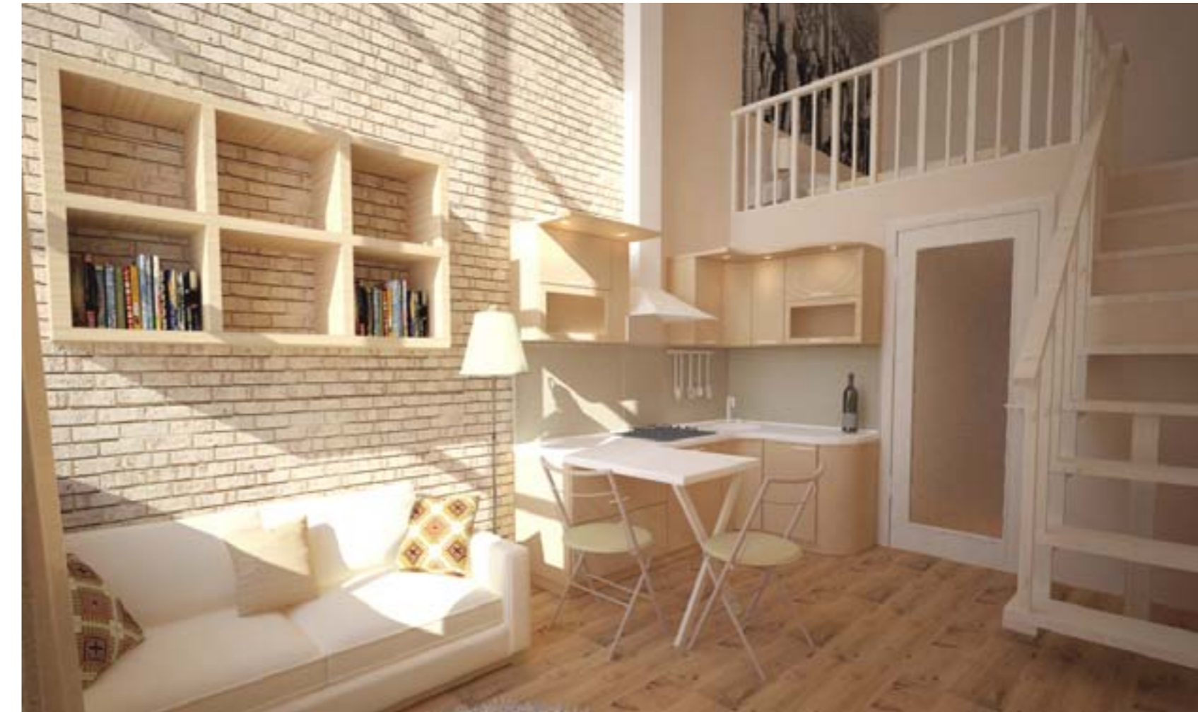
«Interior of a room for students»