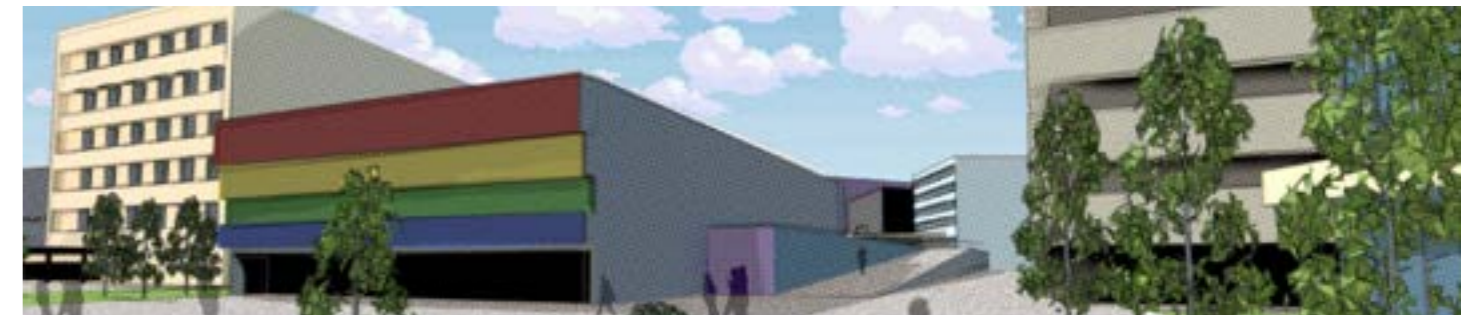
Проект нового центра города. Проектируемый участок - г.Ангарск