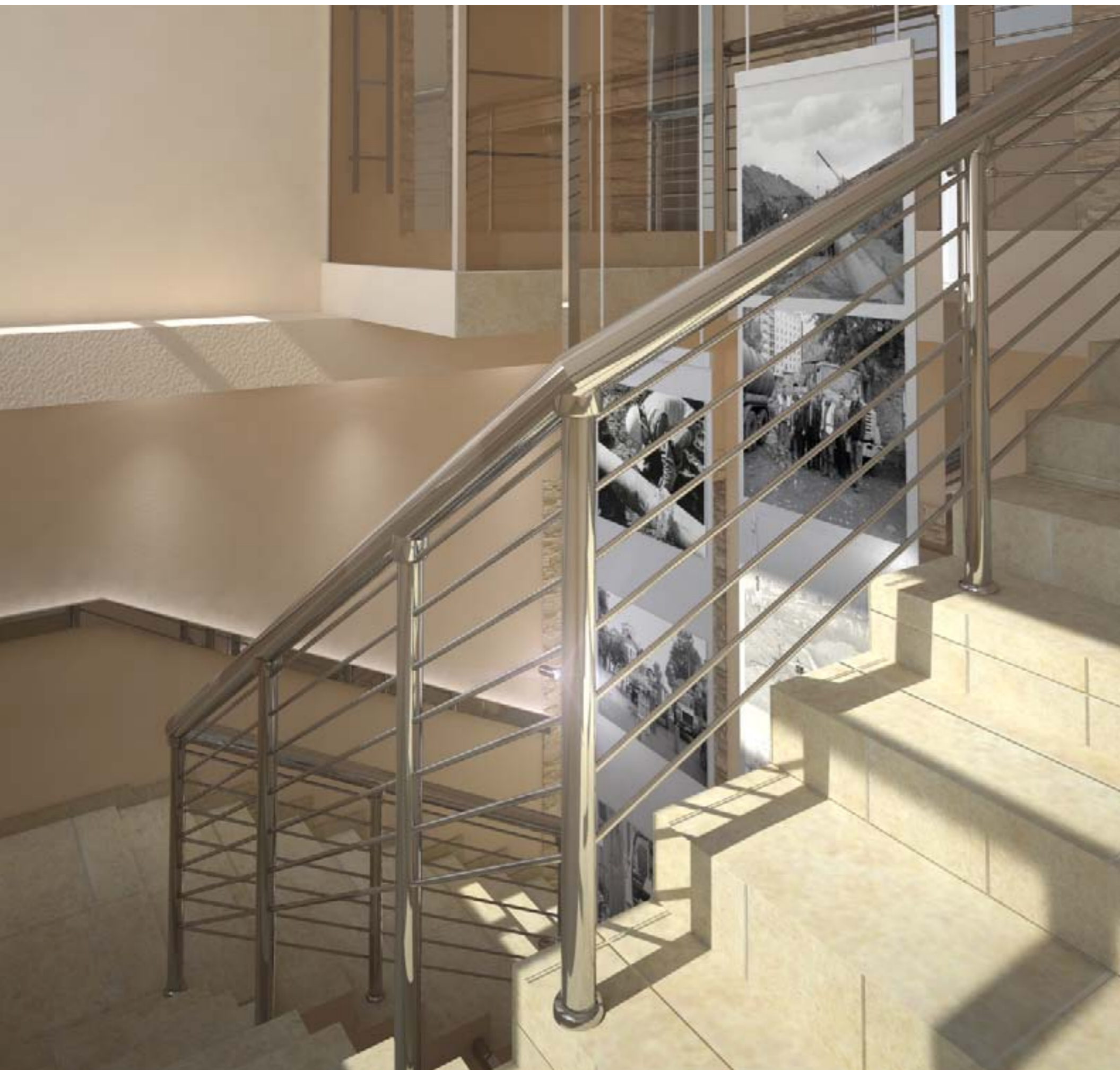
«Интерьер фойе и лестничной клетки здания АБК КрасКом»