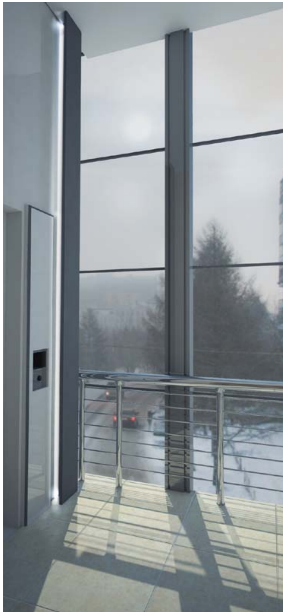
«Staircase and foyer of a building of the municipal company Kraskom.»