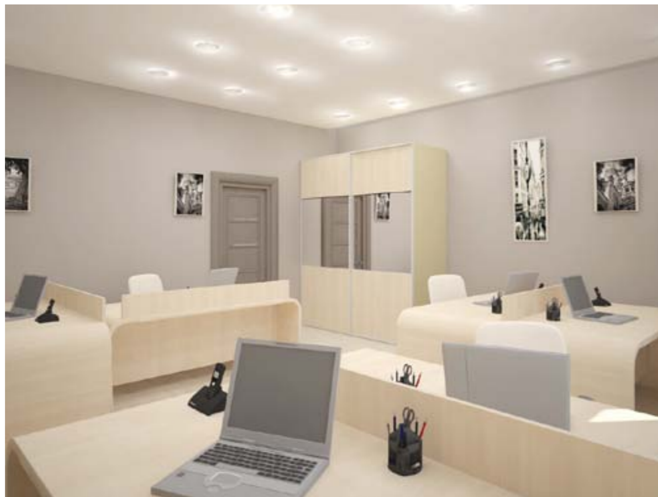
«Интерьер офисного помещения в проектируемом объекте апар отель.»