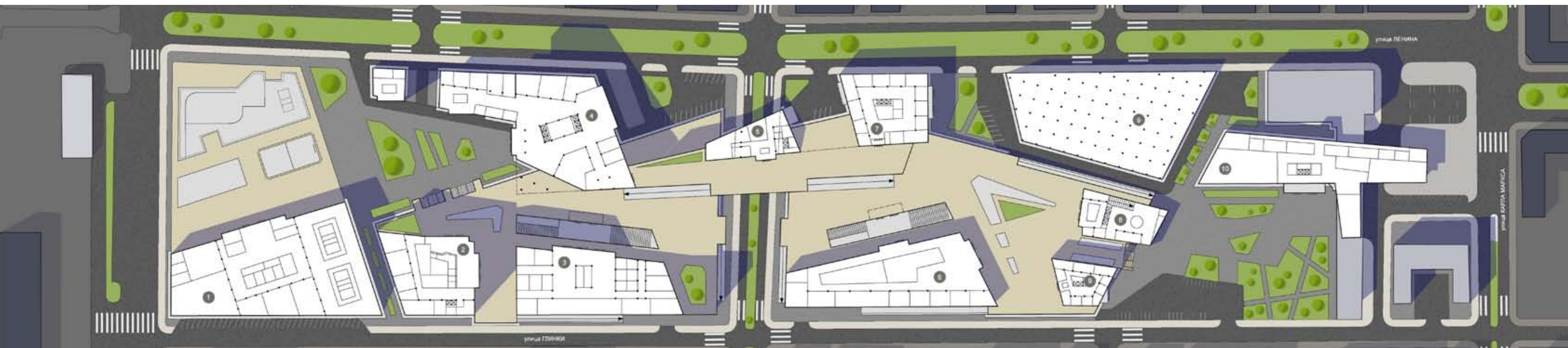
The project of new city centre. Projected site - Angarsk