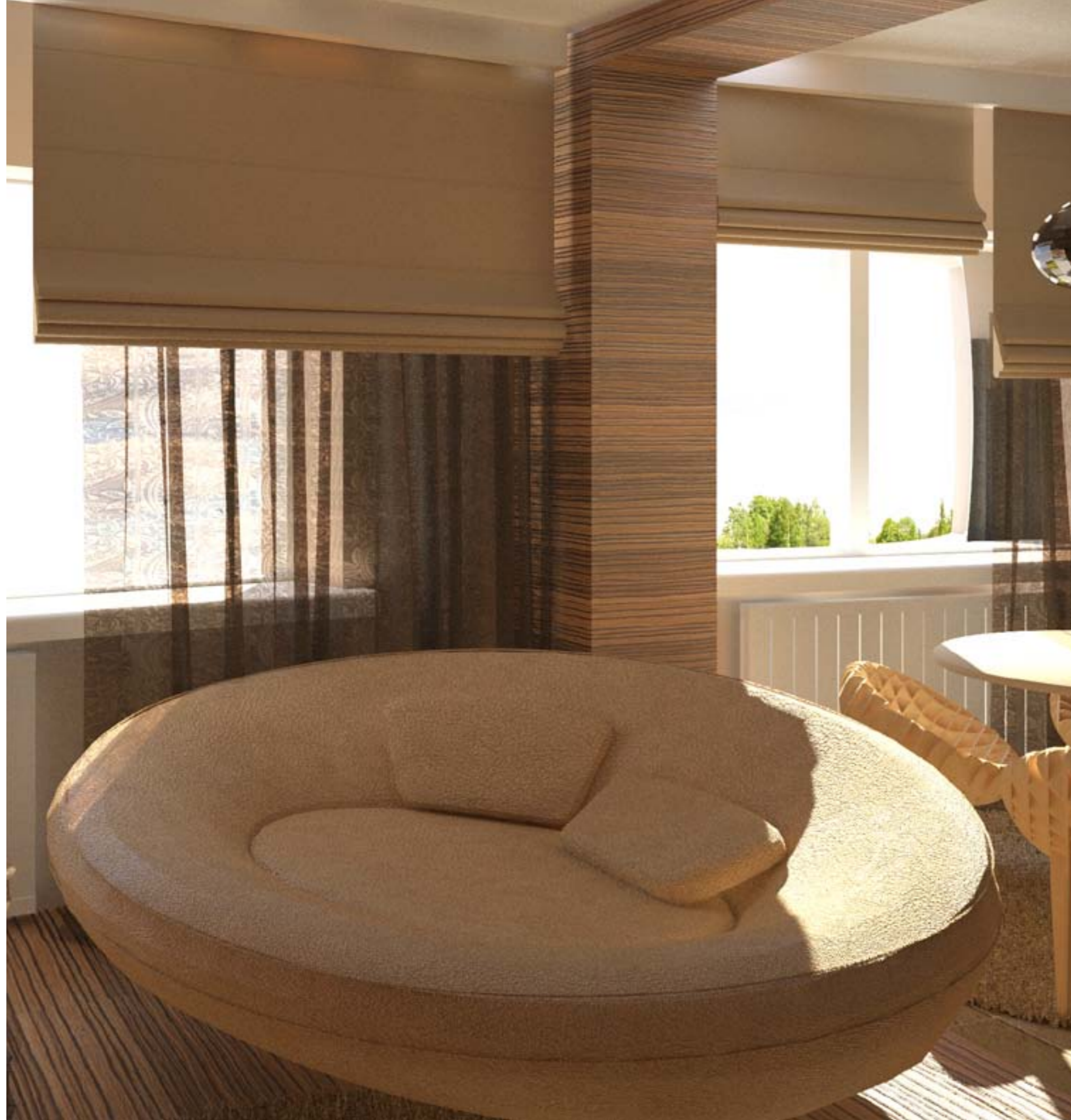
Интерьер квартиры жилого дома средней этажности Учебный проект.