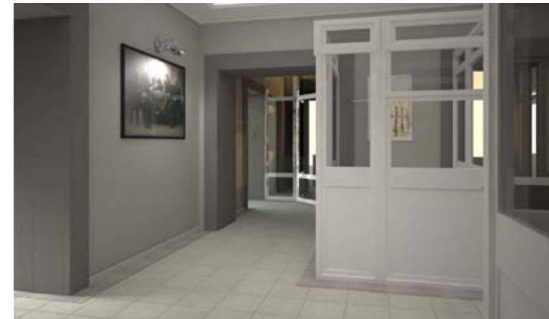
«Лестничная клетка и фойе здания коммунальной компании КрасКом.»