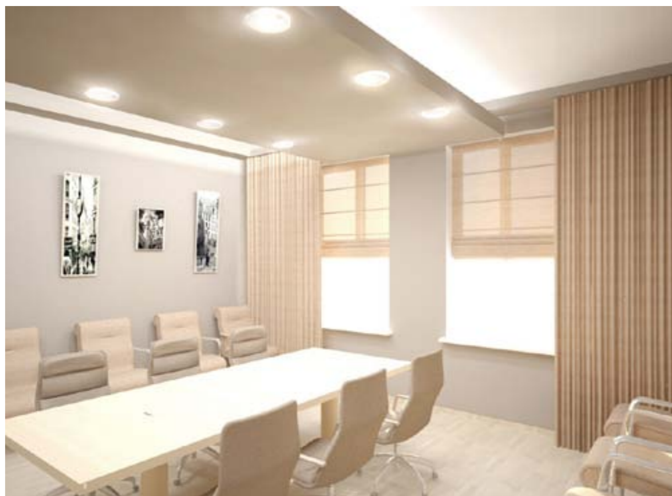
«Interior of office premise in projected object apart hotel.»