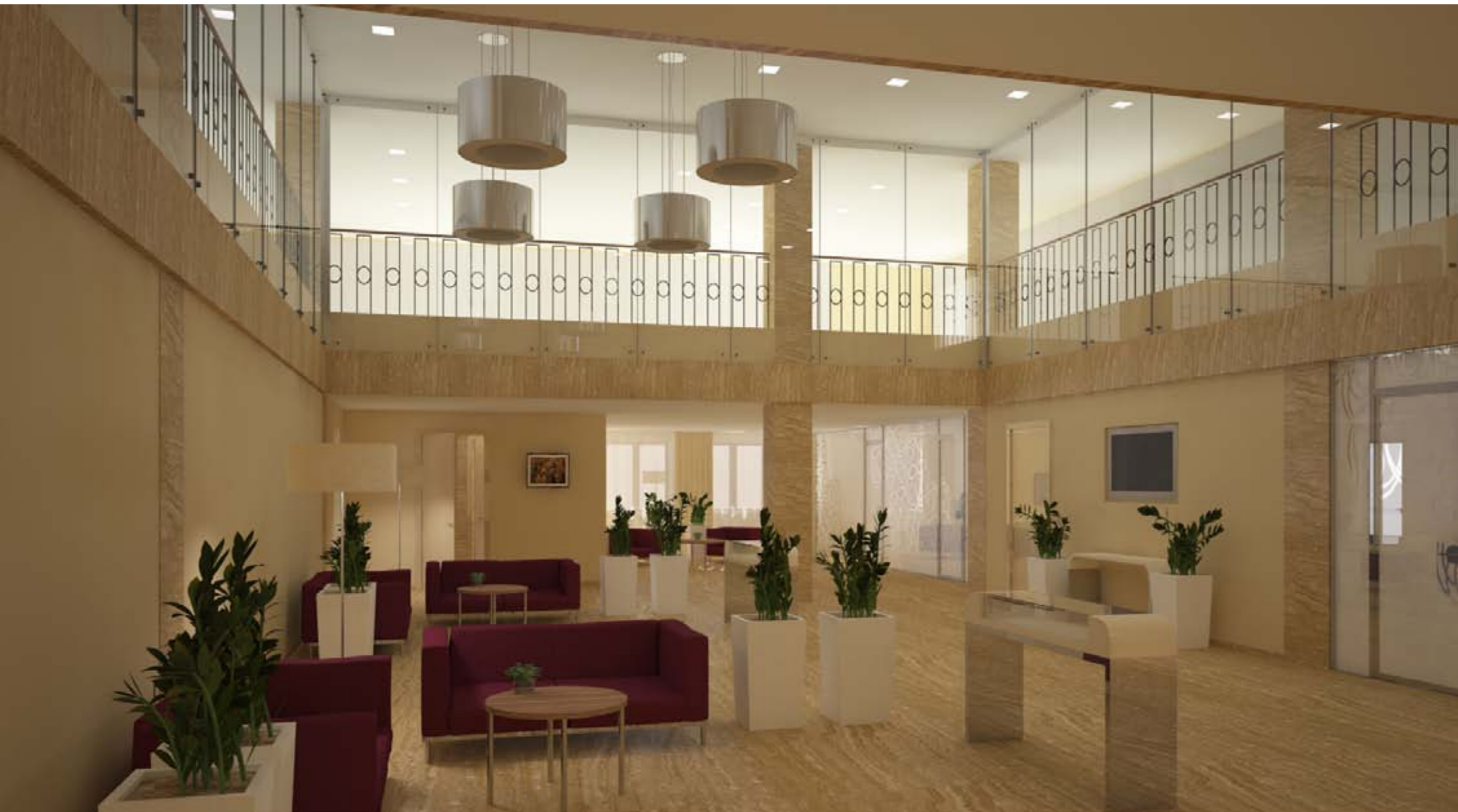
«Интерьер VIP отделения Сбербанка по адресу пр.Красноярский рабочий 150а»