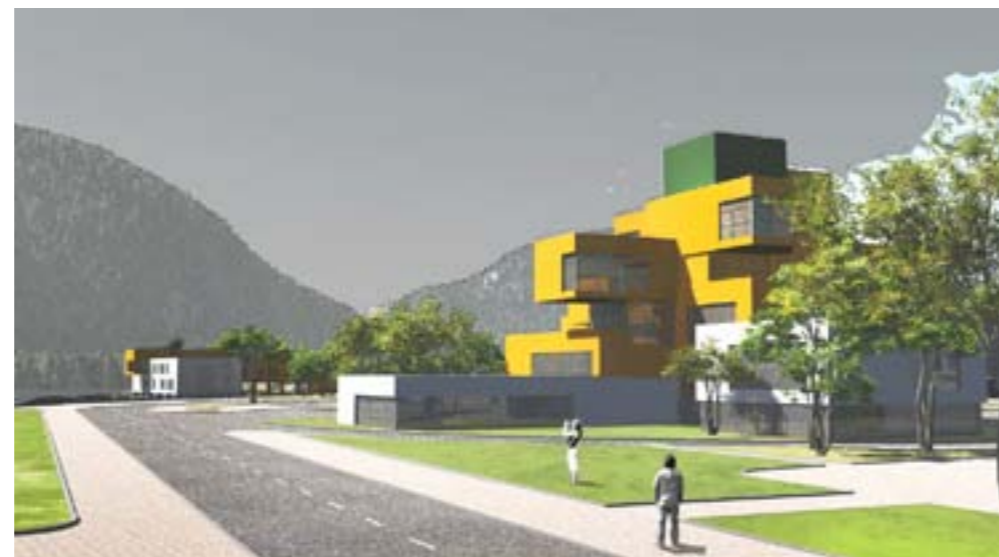
The educational project of settlement on 2000 inhabitants The location in territory of existing settlement on Mana river. Krasnoyarsk.