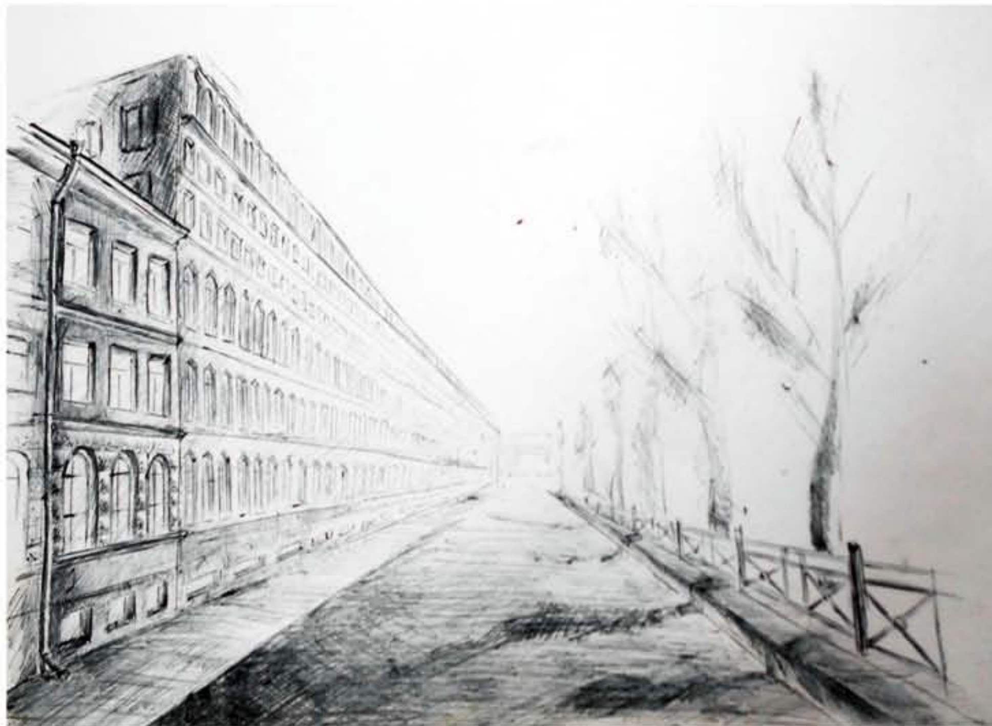
ЭСКИЗ. Г. САНКТ-ПЕТЕРБУРГ ФОРМАТ: А3