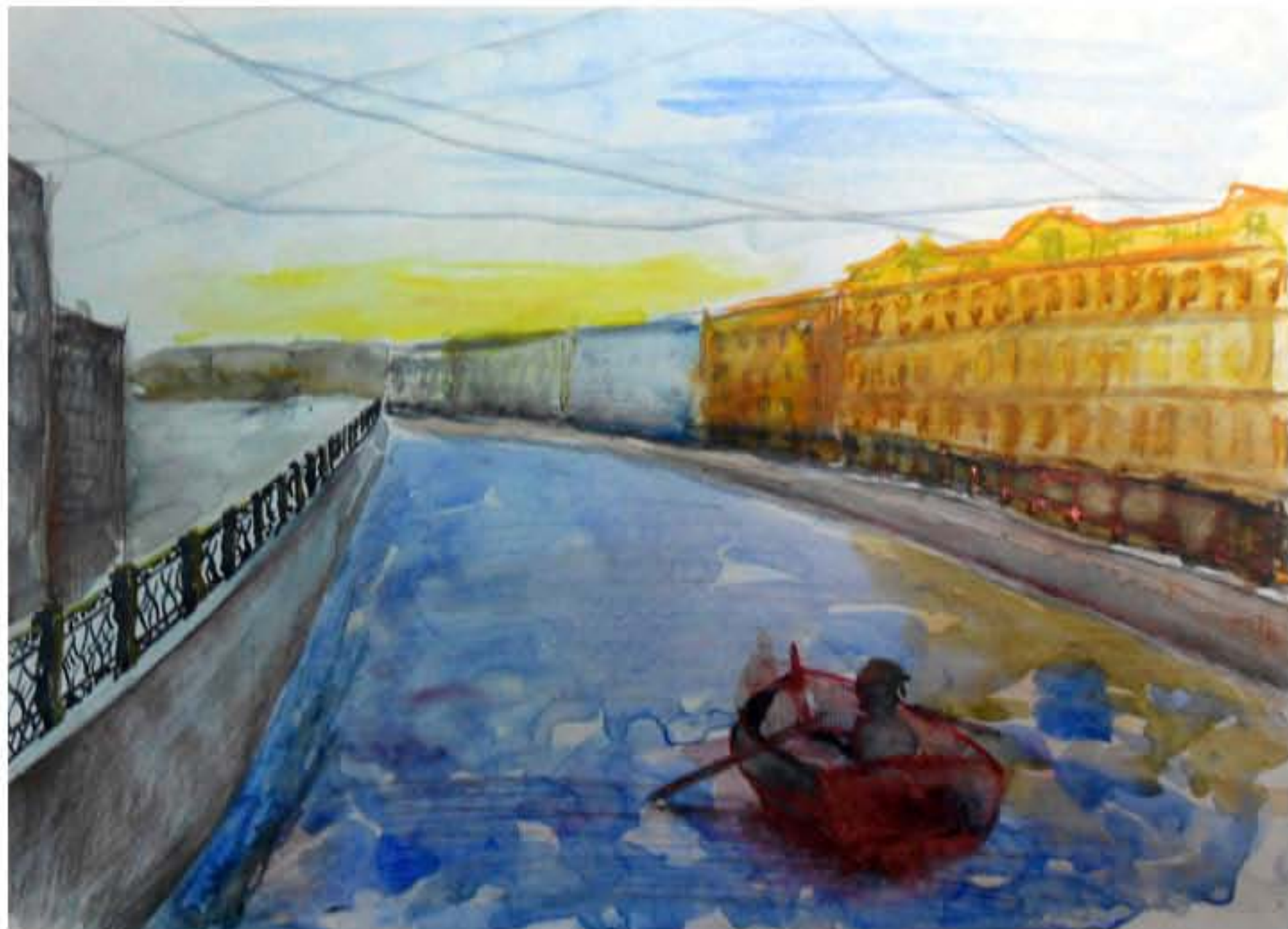
ЭСКИЗ. Г. САНКТ-ПЕТЕРБУРГ ФОРМАТ: А3