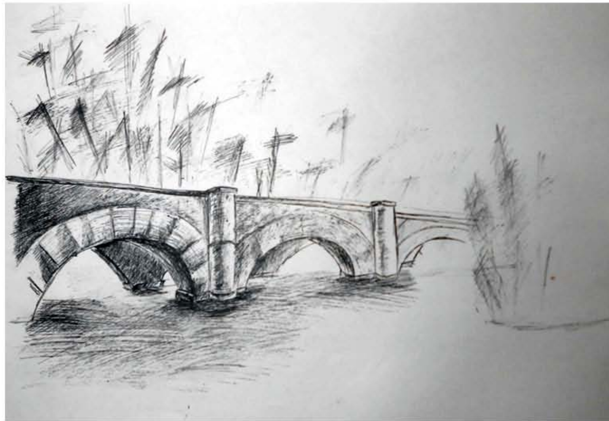
ЭСКИЗ. Г. САНКТ-ПЕТЕРБУРГ ФОРМАТ: А3