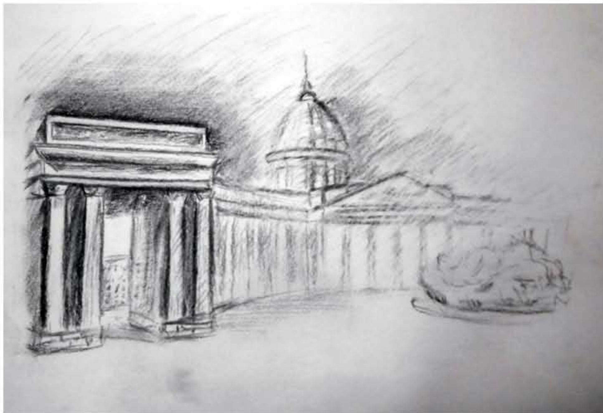
ЭСКИЗ. Г. САНКТ-ПЕТЕРБУРГ ФОРМАТ: А3