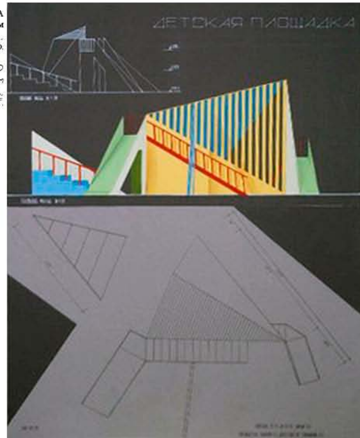
PLAYGROUND SIZE: 50cm x 75cm TEACHERS: BATALOVA N.S., DUBINKOVA T.Y., TIRISHKINA T.F.