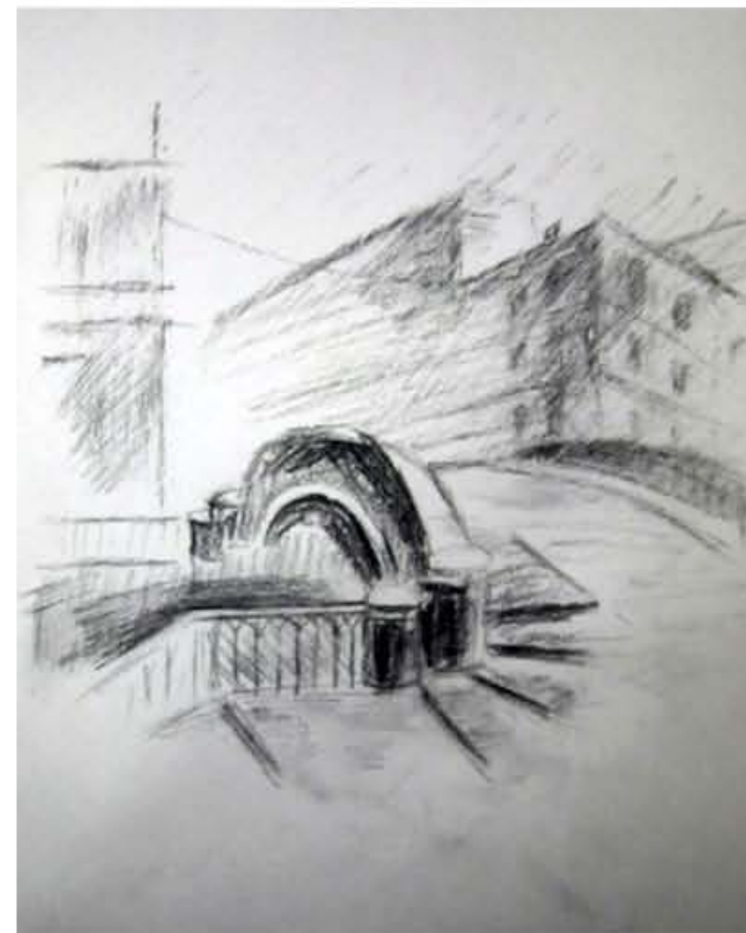
ЭСКИЗ. Г. САНКТ-ПЕТЕРБУРГ ФОРМАТ: А3