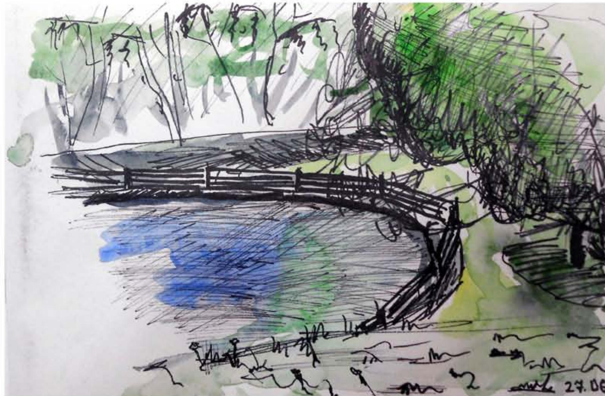
ЭСКИЗ. Г. МОСКВА ФОРМАТ: А4