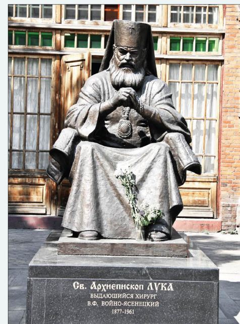
Св. Архиепископ ЛУКА выдающийся хирург В.Ф. ВОЙНО-ЯСЕНЕЦКИЙ 1877-1961