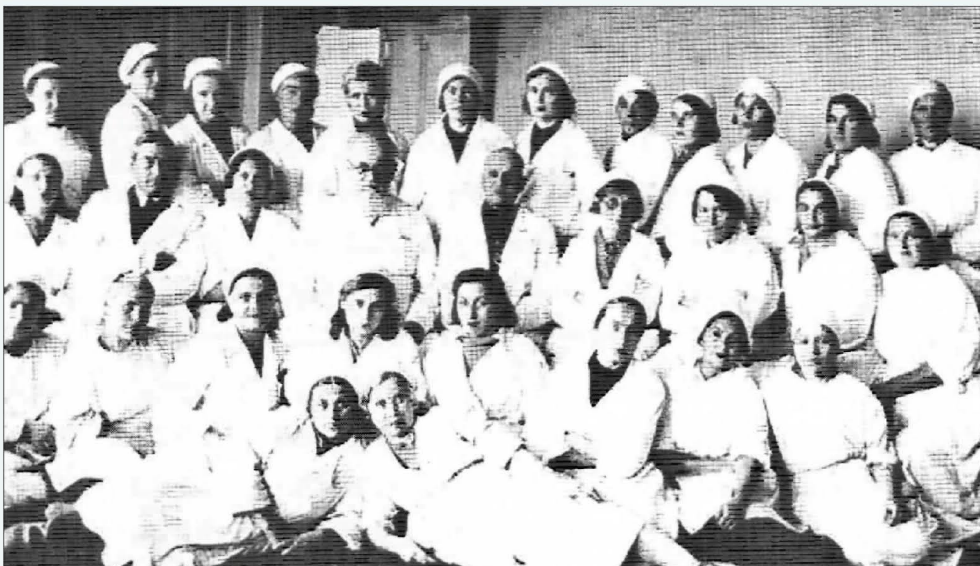
Профессор В. Ф. Войно-Ясенецкий (четвёртый слева во втором ряду) среди медицинского персонала эвакогоспиталя 1515, 1942 г.